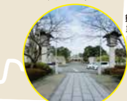
市営中央駐車場 市営中央停车场