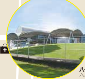
八代商工会議所 八代商工会议所